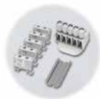
Zestaw z zaciskiem, adapterem/szyną DIN