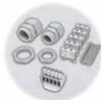
Dławnice kablowe, zacisk i adapter/szyna DIN - zestaw akcesoriów